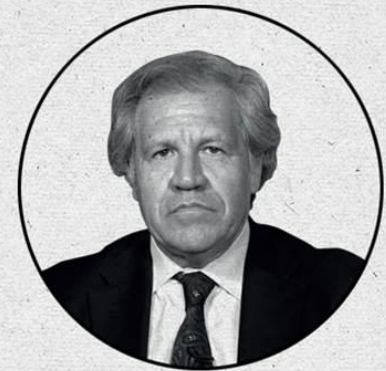
LUIS ALMAGRO, "NEW YORK TIMES", 24 DE MARZO DE 2017.

Desde su existencia, la Carta Democrática sólo de aplicó una vez: tras el golpe de Estado en Honduras en 2009. Sólo pudo volver 2 años después.