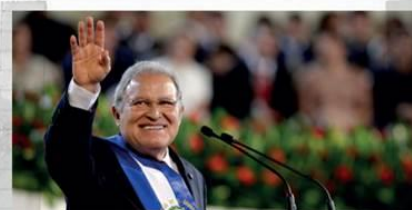
SALVADOR SÁNCHEZ CERÉN - PRESIDENTE EL SALVADOR

"Nos reúne hoy la necesidad de que como países hermanos y, en consonancia con la solidaridad que profesamos desde la CELAC, sumemos esfuerzos para que Venezuela pueda encontrar muy pronto la paz y estabilidad que anhela"