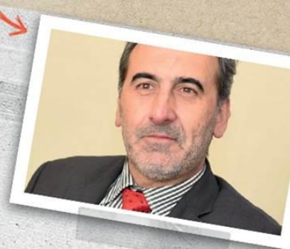
EDISON LANZA, RELATOR PARA LA LIBERTAD DE EXPRESIÓN DE LA OEA

"Lo novedoso de la situación actual es que por primera vez los países representados en los órganos políticos del Sistema Interamericano, en particular en el Consejo Permanente de la OEA, alcanzan las mayorías reglamentarias para condenar al gobierno venezolano, determinar que se quebrantó el hilo constitucional e intimar al gobierno a reestablecer la democracia."