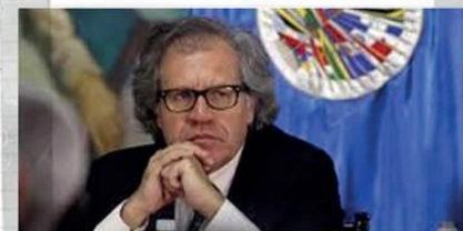
LUIS ALMAGRO - SECRETARIO GENERAL DE LA OEA.

"El régimen cívico-militar de Venezuela representa lo peor de cada dictadura". "En Venezuela, el estado de derecho no existe ni siquiera como apariencia"