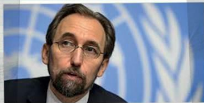
ZEID RA'AD AL HUSSEIN - ALTO COMISIONADO PARA LOS DERECHOS HUMANOS DE LA ONU.

"Exhorto firmemente a la Corte Suprema a que reconsidere su decisión. La separación de poderes es fundamental para que funcione la democracia, así como mantener los espacios democráticos abiertos es esencial para asegurar que los derechos humanos estén protegidos."